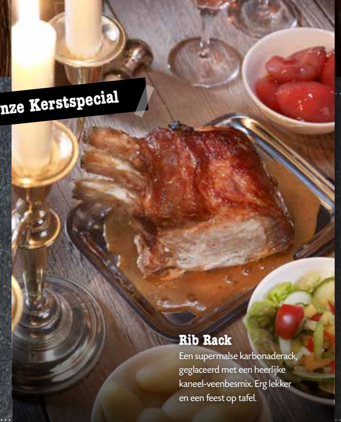
Rib Rack Een supermalse karbonaderack, geglaceerd met een heerlijke kaneel-veenbesmix. Erg lekker en een feest op tafel.